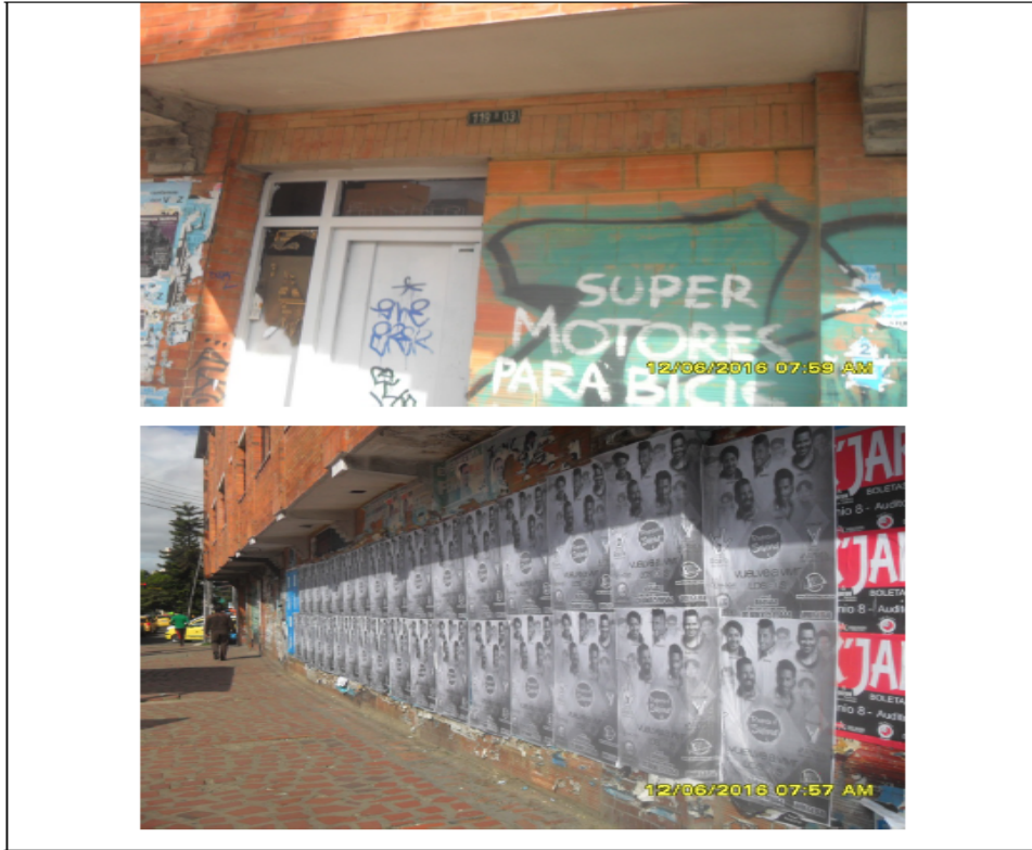
FOTOGRAFÍAS 7 y 8 AVENIDA CARRERA 45 CON CALLE 8o COSTADO OCCIDENTAL