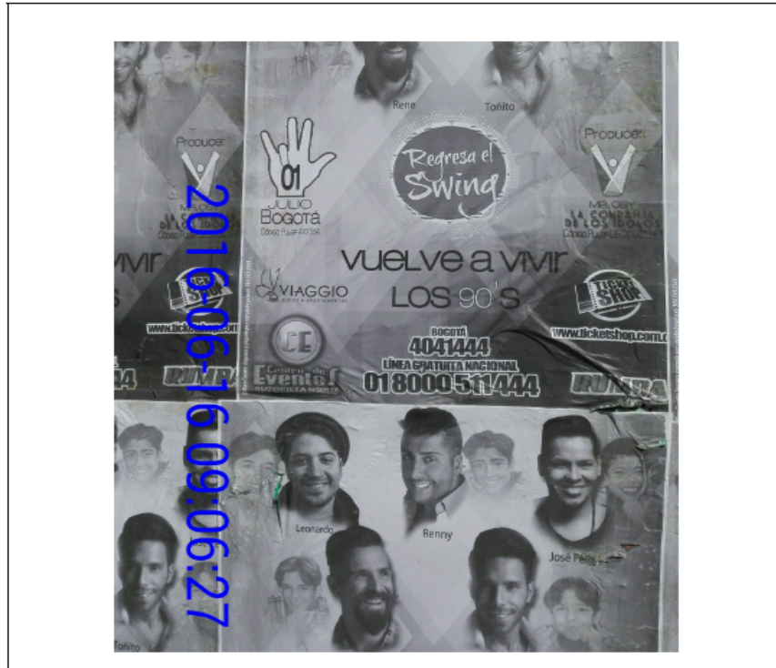
FOTOGRAFÍAS 4, 5 y 6 CARRERA 7 No 119 A -03